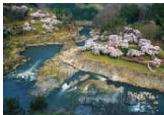
フォトコンテスト最優秀賞作品