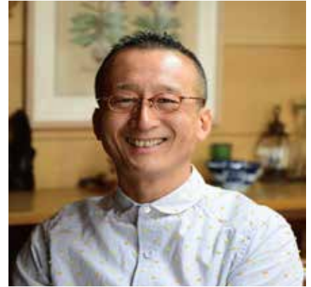
いまもり みつひこ 講師 今森光彦氏

1954年、滋賀県生まれ。写真家。琵琶湖をのぞむ田園風景の中にアトリエを構え活動する。自然と人との関わりを「里山」という空間概念で追い続ける。また、自然のかたちをハサミひとつで鮮やかに切り出すペーパーカット作家としても知られる。写真集に『里山物語』（新潮社）、『湖辺』（世界文化社）、『世界昆虫記』（福音館書店）、『里山を歩こう』（岩波書店）など数多くの著書がある。第20回木村伊兵衛写真賞、第28回土門拳賞、小学館児童出版文化賞など数多くの賞を受賞。