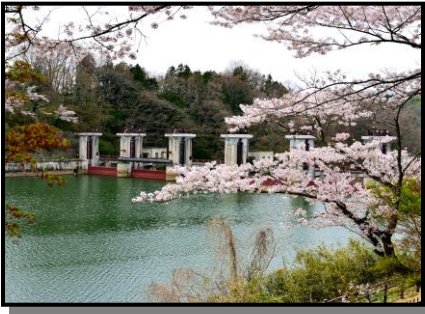
12 入 選 「ダム湖の春」 撮 影 場 所 福島市