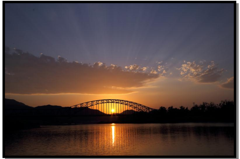
5 準優秀賞 「あすも晴れ」 撮影場所 丸森町