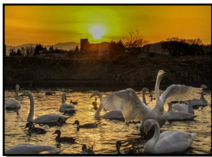
15 入 選 「夕映え」 撮 影 場 所 福島市