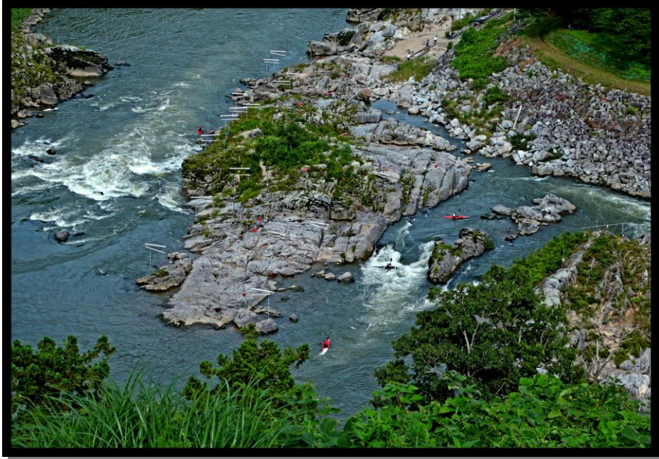
2 優秀賞 「明日に備えて」 撮影場所 二本松市