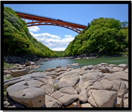
9 入 選 「鮎滝渡船場跡」 撮 影 者 寺島 脩二(福島市) 撮 影 場 所 福島市