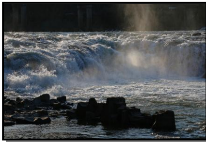
13 入 選 「水 煙」 撮 影 場 所 玉川村