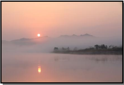
7 入 選 「朝日と煙る」 撮 影 場 所 角田市