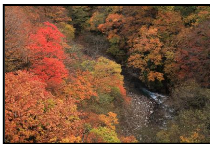
16 入 選 「阿武隈川の秋の源流」 撮 影 場 所 西郷村