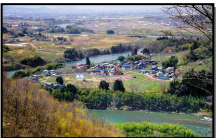
11 入 選 「桃源郷と共に」 撮 影 場 所 伊達市