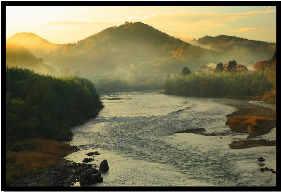
3 優秀賞 「秋景」 撮影場所 丸森町