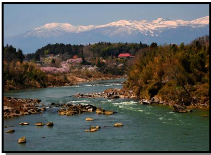
14 入 選 「故郷の川」 撮 影 場 所 二本松市