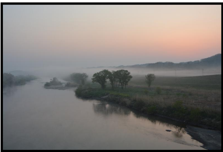
6 準優秀賞 「静かな夜明」 撮影場所 郡山市