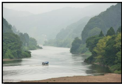
10 入 選 「阿武隈川ライン舟下り」 撮 影 者 小檜山 裕行(角田市) 撮 影 場 所 丸森町