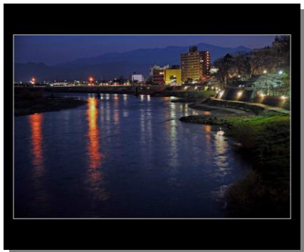
8 入 選 「メルヘンの流れ」 撮 影 場 所 福島市